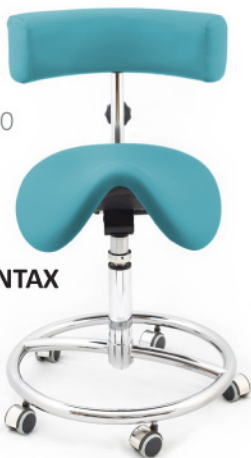
CLINE K DENTAX